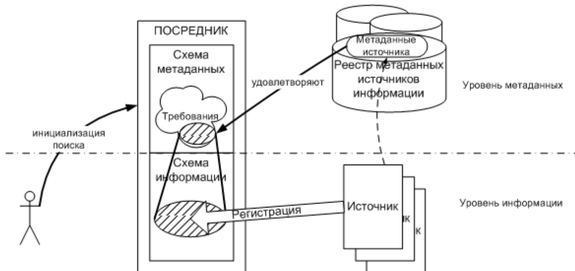
Рисунок 2. Интерпретация результатов поиска

meta1Mediator(x) \ \& \ ageOfInformation < 3 \ \& \ meta2Mediator(x) \ \& \ ageOfInformation < 5;